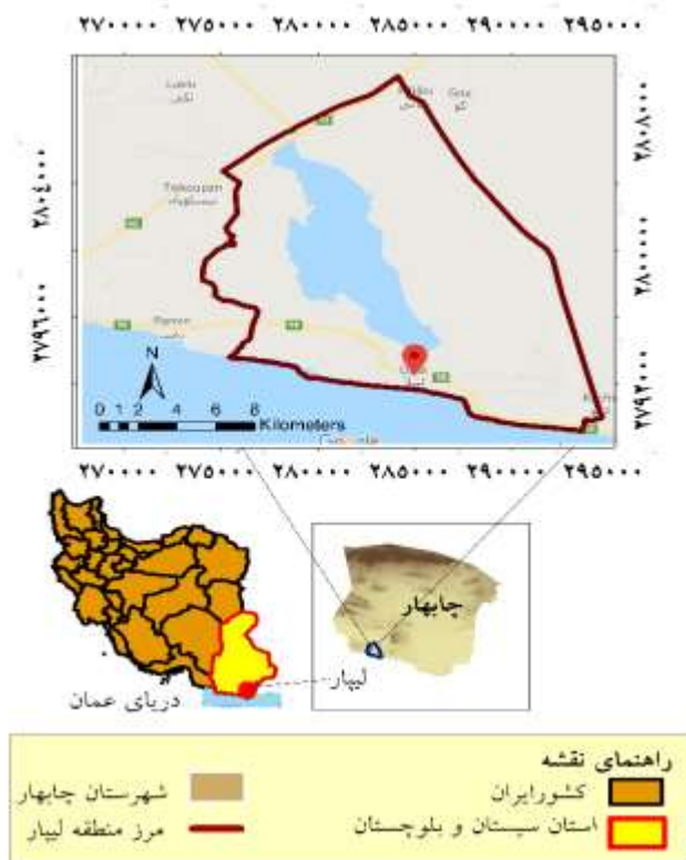
شکل ۱- موقعیت جغرافیایی منطقه لیپار در کشور و استان

شناسایی پوشش گیاهی و حیات‌وحش منطقه با استفاده از روش کاملا تصادفی با مشاهده مستقیم گونه‌ها و بررسی صفات ریخت‌شناسی آن‌ها انجام گرفت.