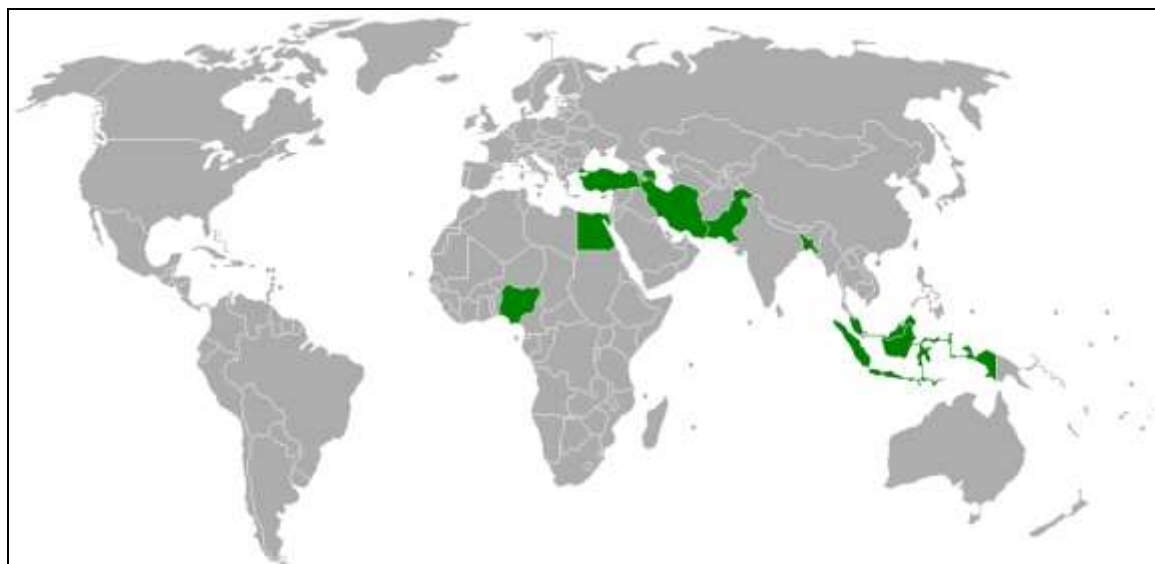
شکل ۱- نقشه پراکنش کشورهای D-8

ناخالص داخلی بر جمعیت حاصل می‌شود. این معیار بر حسب برابری قدرت خرید و به قیمت‌های ثابت سال ۲۰۲۱ است.