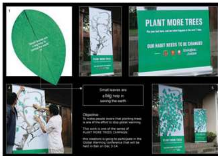
شکل ۲- درختان بیشتری بکارید، بالی، اندونزی، ۲۰۱۴