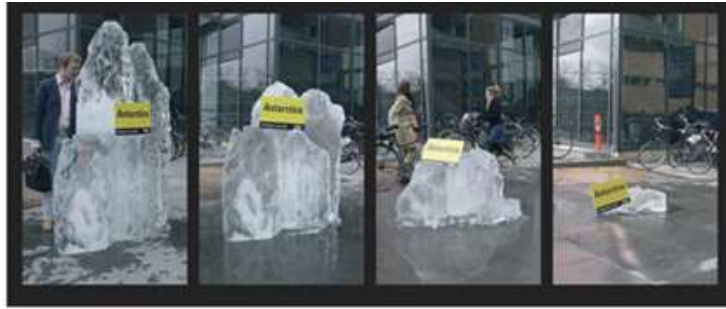
شکل ۱- آنتراکتیکا، دانمارک، ۲۰۰۶