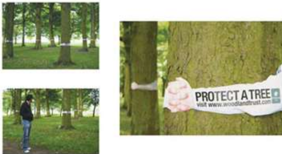
شکل ۴- از یک درخت حمایت کن، انگلستان