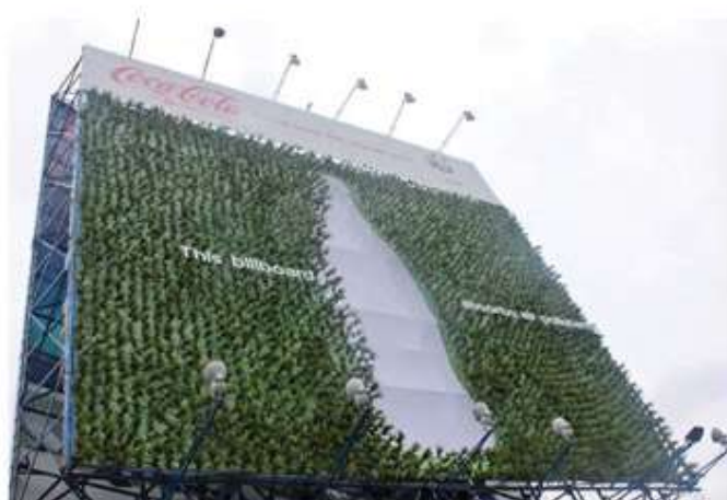
شکل ۳- این بیلبرد آلودگی هوا را جذب می کند.