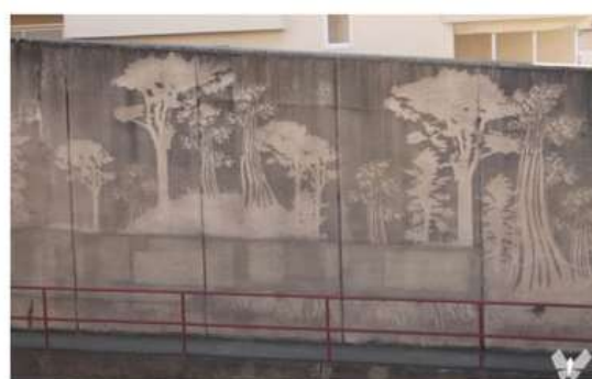
شکل ۵- سایه درختان در بزرگراه، سان فرانسیسکو، ۲۰۱۳